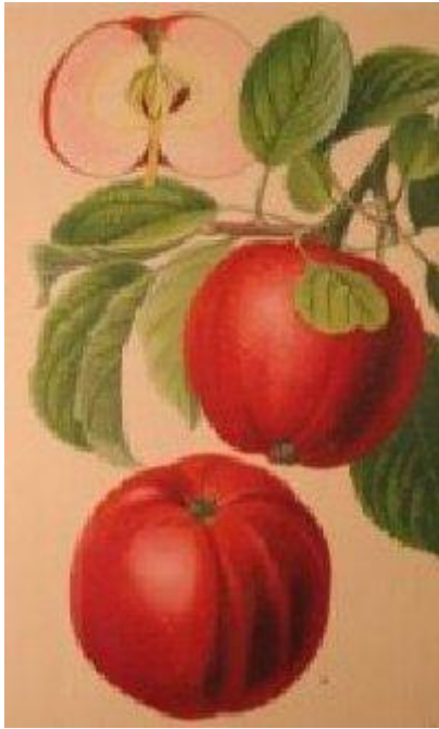
Deutsche Kernodtsorten, 1900, von